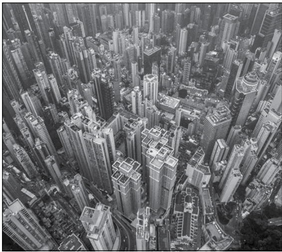
စုံမူမရှိသည့် ဖွံ့ဖြိုးဆဲ နိုင်ငံများအတွက် များစွာ အရေးပါသည်။

SEZs ဆိုသည်မှာ နိုင်ငံတွင်းရှိ အခြားဒေသများ၏ စီးပွားရေး၊ ကုန်သွယ်ရေး ဥပဒေများနှင့် ကွဲပြားခြားနားကာ သီးခြားသတ်မှတ်ထားသည့် နယ်ပယ်တစ်ခုဖြစ်ပြီး ကုန်သွယ်ရေး၊ ရင်းနှီးမြှုပ်နှံမှုအလုပ်အကိုင်အခွင့်အလမ်းများနှင့် ထိရောက်၍ အကျိုးရှိသော စီမံခန့်ခွဲမှုဖြင့် အကောင်အထည်ဖော်ဆောင်ရွက်သော နယ်ပယ်တစ်ခုဖြစ်သည်။ ဇုန်အတွင်းစီးပွားရေးလုပ်ငန်းများ စတင် တည်ထောင်မည်ဆိုပါက ရင်းနှီးမြှုပ်နှံမှု၊ အခွန်ကောက်ခံခြင်း၊ ကုန်သွယ်ရေး၊ ဝေပျံ့ အကောက်အခွန်နှင့်အလုပ်သမားဆိုင်ရာလုပ်ထုံးလုပ်နည်းများ အစရှိသည့် ငွေကြေးဆိုင်ရာ မူဝါဒများအား စတင်ရေးဆွဲရပြီး ကုမ္ပဏီများ အတွက် အခွန်ကင်းလွတ်ခွင့် ကာလ tax holidays များနှင့် သတ်မှတ်ကာလအတွင်း အခွန်ကောက်ခံမှုနှုန်းထားအား လျော့ချပေးသည်။ SEZs များသည် ပြောင်းလဲမှုများ နှေးကွေး၍ စီးပွားရေးဆိုင်ရာ အခြေခံအဆောက်အအုံ ပြည့်