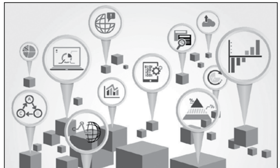
၂၀၁၂ ခုနှစ်မှ လက်ရှိအချိန်အထိ နှစ်စဉ် ကိုရီးယားနိုင်ငံ၏ ဥပဒေရေးရာဆိုင်ရာ ထုတ်ပြန်ထားမှု အခြေအနေ

(ဏ) ဥပဒေကိုပြည်သူလူထုအတွက်ပြန်တမ်းအနေဖြင့် ထုတ်ပြန်ခြင်းစသည်ဖြင့် အဆင့်ဆင့်ဆောင်ရွက်ကြောင်း သိရှိရပါသည်။